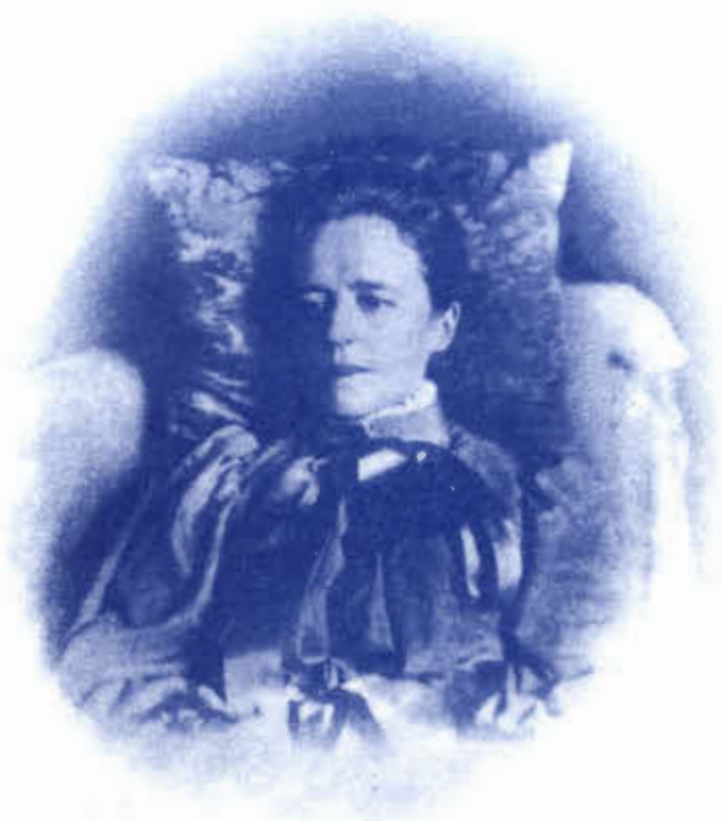
Alicja James w Londynie, październik 1891 roku.

„Alicja w łóżku” - swobodna fantazja dramatyczna napisana w oparciu o życie prawdziwej osoby, Alicji James (1848 - 1892), siostry Wiliama i Henry Jamesów - największego amerykańskiego psychologa i moralisty i największego amerykańskiego pisarza - która, mimo swoich niepospolitych zdolności, nie zrobiła żadnej kariery. Czy dlatego, że była kobietą, a w definicji kobiety mieści się obowiązek bycia atrakcyjną fizycznie, cierpliwą, uległą, matczyną, posłuszną, wrażliwą, ustępującą ojcom (braciom, mężom), co staje w sprzeczności z egocentryzmem, agresywnością tak niezbędnymi do ujawnienia się twórczego talentu.